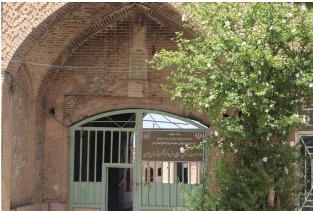
تصویر ۲. نمای سردر کاروانسرائی حیدریه فارس. تاریخ ساخت ۱۳۲۴ق

«بسم الله الرحمن الرحيم. الحمد لله والتوفيق من الله. در عهد سلطان اعظم محمدعلی شاه - خلد الله ملکه - بنای این سرای رفیع نمود جناب اجل الحاج حیدرعلیخان عزالملک، فی تاریخ محرم ۱۳۲۴، به سعی حاج محمدباقر معمار، تمنای طلب مغفرت دارم.