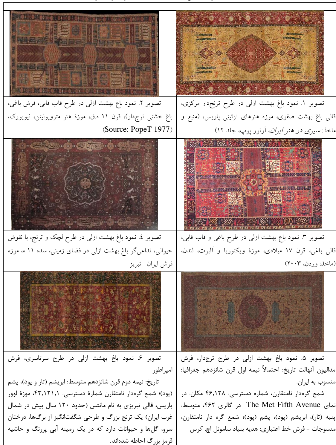
جدول ۱. مشخصات تصویری فرش‌های باغی در نمونه‌های منتخب فرش - باغ دوران صفوی در موزه‌ها