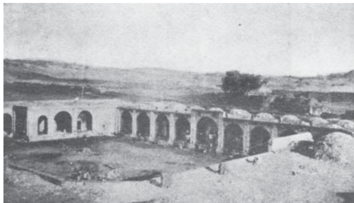
ت ۲. (چپ) جلوخان و سردر کاروان‌سرای علی‌آباد. مأخذ: سیرو، کاروانسراهای ایران