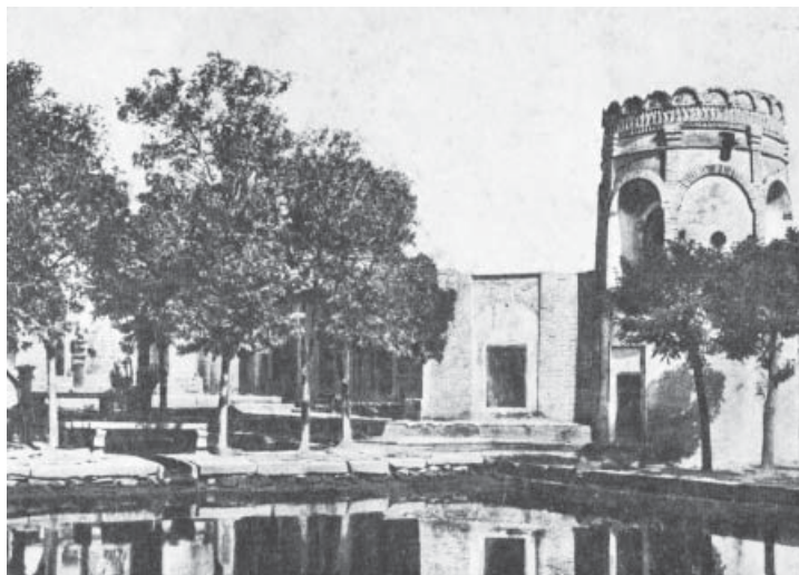
ت ۷. (بالا) استخر و مهمانخانه علی‌آباد.

در برابرمان باغی انباشته از درختان خرزهره سرخ‌رنگ است، که تصویرشان در آب حوض بزرگ مربع‌شکلی