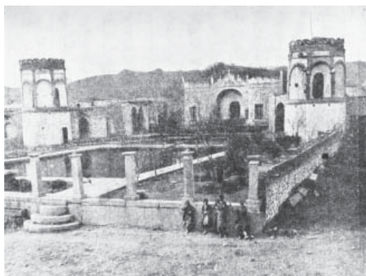
ت ۸. (پایین) استخر و مهمانخانه علی‌آباد. عکس از سیورگین، مأخذ: دوراند، سفرنامه دوراند

آسیاب آبی، در بالادست مجموعه، در حد رفع نیاز ساکنان و مسافران مجموعه بوده است. در مجموعه علی‌آباد، با آسیاب و نانواپی و حمام و قهوهخانه، همه نیازهای مسافران برآورده می‌شده است.