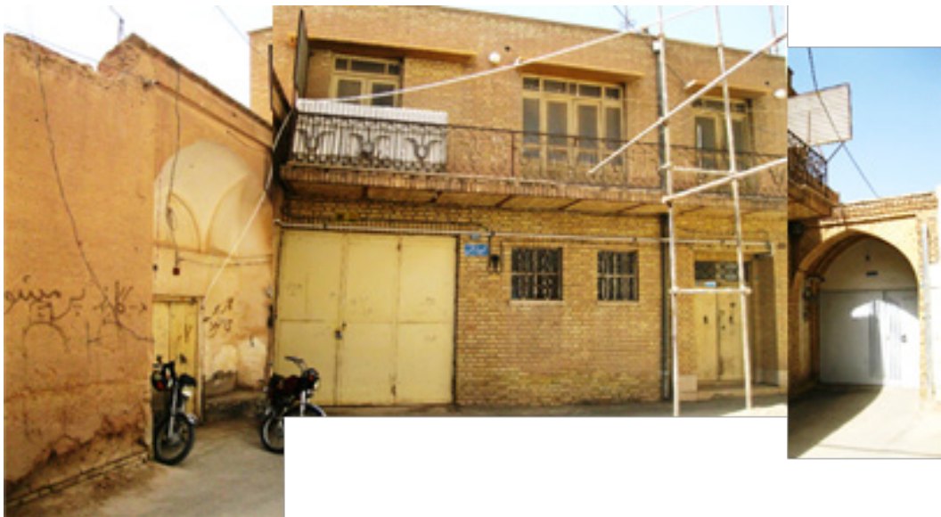
ت ۶. این سه ورودی زیبا متعلق به سه دوره قاجار، پهلوی اول و دوم از طریق اشدگاهی در انتهای بن‌بست همجواریند.