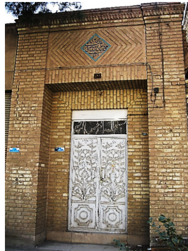
ت ۵. نمونه‌هایی از ورودی‌های گونه باستان‌گرا در دوره پهلوی اول.