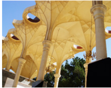
ت ۱۴. نمونه‌هایی از ورودی‌های گونه فرانگرا در دوره جمهوری اسلامی. مأخذ: نگارنده.